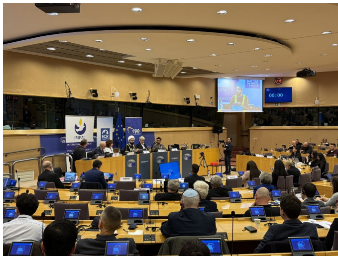
Der Saal des Europäischen Parlaments während der Rede von Imam Tawhidi

Tawhidi führte aus, dass sich die vor fast einem Jahrhundert gegründete Muslimbruderschaft zur „Mutter des modernen dschihadistischen Terrors“ entwickelt habe und direkt Gruppen wie Al-Qaida, den IS und die Hamas hervorgebracht habe – Organisationen, die weltweit als terroristisch verurteilt werden. Er wies darauf hin, dass Länder wie Ägypten, Saudi-Arabien, die Vereinigten Arabischen Emirate und Bahrain die Organisation seit langem als terroristische Vereinigung einstufen und ihre Aktivitäten verboten haben, da sie eine existenzielle Gefahr darstelle, während westliche Demokratien ihr gegenüber alarmierend tolerant blieben. „Sie ersetzen authentische muslimische Stimmen durch Stellvertreter, die den politischen Islam vorantreiben und den Glauben als Waffe einsetzen, um Spaltung zu säen“, erklärte Tawhidi wörtlich und betonte, wie die Gruppe Gesetzeslücken ausnutzt, um Jugendliche zu radikalisieren und ihre Agenda unter humanitären Vorwänden zu fördern.