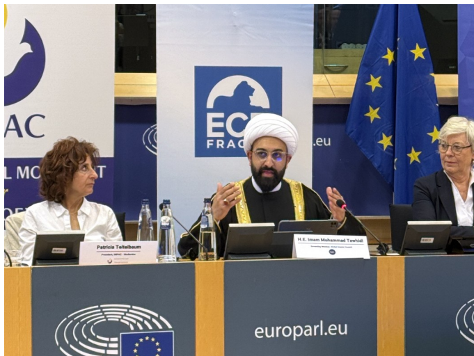
Imam Tawhidi während seiner Rede

(Bonn, 20.05.2026) Im Europäischen Parlament fand eine hochrangige Konferenz mit dem Titel „Safeguarding Europe: Exposing the Growing Threat of the Muslim Brotherhood“ (Europa schützen: Die wachsende Bedrohung durch die Muslimbruderschaft aufdecken) statt. Die von den Europaabgeordneten Bert-Jan Ruissen (ECR) und Thomas Zdechovský (EVP) ausgerichtete Veranstaltung brachte Sicherheitsexperten, Menschenrechtsaktivisten und Vertreter verfolgter Minderheiten aus dem Nahen Osten zusammen, um die Strategie der Muslimbruderschaft zur Unterwanderung von Institutionen zu analysieren. Im Mittelpunkt der Konferenz stand der Bericht „Unmasking the Muslim Brotherhood“, der detailliert beschreibt, wie die Gruppe „Infiltrierung“ nutzt, um Wissenschaft und politische Institutionen zu beeinflussen. Im Gegensatz zum friedlichen Islam, bei dem die individuelle Glaubensausübung im Mittelpunkt steht, verfolgt die Bruderschaft eine strategische politische Agenda, deren Ziel die Errichtung eines von der Scharia regierten Staates ist, in dem eine bestimmte Weltanschauung vorherrscht.