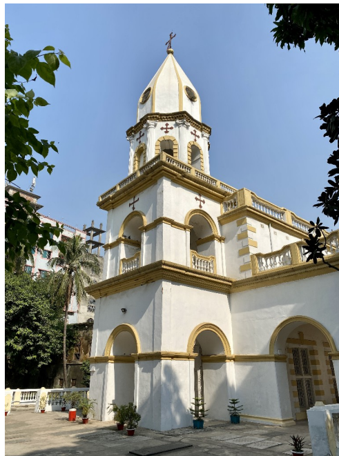
Die armenische Kirche in Dhaka Bangladesch

SOS World (Brüssel) sosworld.be/page-daccueil/