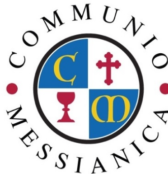
Logo von Communio Messianica

Sein Glaube war niemals nur eine Privatsache. Er prägte seinen Charakter, seine Beziehungen, seine wissenschaftliche Arbeit und sein Zeugnis. Er sprach über Christus nicht mit Feindseligkeit gegenüber anderen, sondern mit tiefer Überzeugung, Demut und aufrichtiger Liebe zu denen, die noch auf der Suche waren. Durch Communio Messianica wurde er zu einer Ermutigung für unzählige Gläubige, insbesondere für diejenigen, die selbst aus einem muslimischen Hintergrund heraus zum Glauben gekommen waren. Er verstand die Herausforderungen, denen sie gegenüberstanden, weil er diesen Weg selbst gegangen war. Seine Weisheit, sein Mitgefühl und sein unerschütterliches Engagement stärkten viele, die sich sonst vielleicht allein gefühlt hätten.