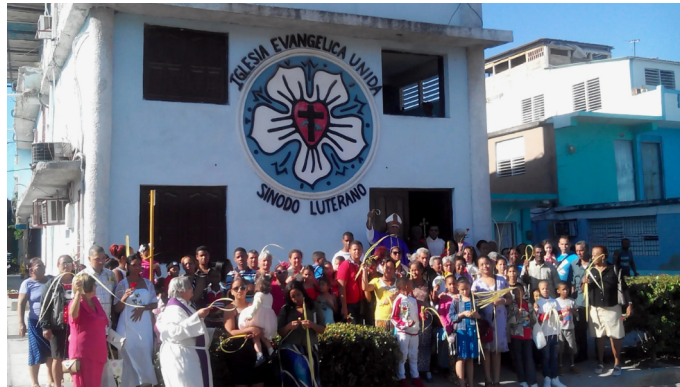
Lutherische Synode in Santiago de Cuba, März 2026

tierten, aber auch der Moderne zugewandten Kirche entwickelt, die tief in die soziale Begleitung der Bedürftigen involviert ist. Diese Arbeit stieß jedoch oft auf den Widerstand durch die jede Initiative erstickende Kommandowirtschaft und eines feindseligen staatlichen Umfelds, in dem Religionsfreiheit, obwohl sie auf dem Papier garantiert ist, nicht in reales Handeln umgesetzt wird. Hilfe im Sinne tätiger Nächstenliebe wird von Repräsentanten des Staates oft mit Argwohn betrachtet und als unerwünschte Konkurrenz abgewürgt.“