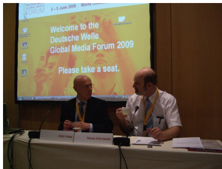
Bild1: Global Media Forum 2009

Wehrbeauftragten des Bundestages, in dem jeder öffentlich (fast) alles erfahren kann, was in der Bundeswehr schiefgelaufen ist und selbst schlecht behandelte Soldaten einen öffentlichen Fürsprecher haben. Leider nutzten, so der Ethiker weiter, viel zu