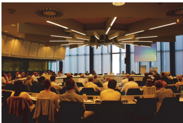
Der Sitzungsraum der EU-Kommission während des Vortrages

freiheitskompatiblen Islam leben und begründen, aber all diejenigen Grenzen zu setzen, die die Demokratie dem Schariarecht nachordnen möchten. Zwischen „Islam“ und „politischem Islam“ sollte in Politik und Gesellschaft sorgfältiger und kenntnisreicher unterschieden werden. Denn von allen Bürgern, religiös oder nicht religiös, kann ein Bekenntnis zu und aktives Eintreten für Menschenrechte, Demokratie, Rechtsstaatlichkeit, Toleranz, Freiheits- und Gleichheitsrechte gefordert werden – und sollte es auch.