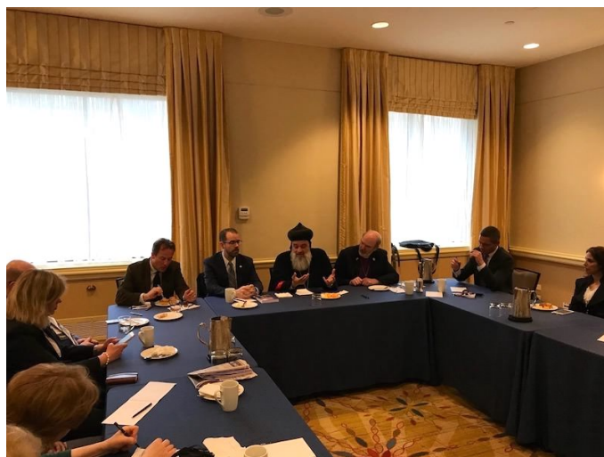
Seine Heiligkeit Patriarch Mor Ignatius Aphrem II. Karim während der Diskussionsrunde