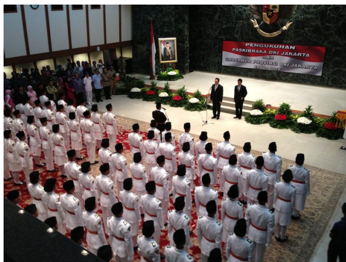
Vereidigung von Polizeirekruten am Nationalfeiertag durch Tjahaja „Ahok“ Purnamas

Nur um zu verhindern, dass ein überaus beliebter christlicher Gouverneur wiedergewählt wird, öffneten nicht nur 200.000 demonstrierende fanatische Muslime