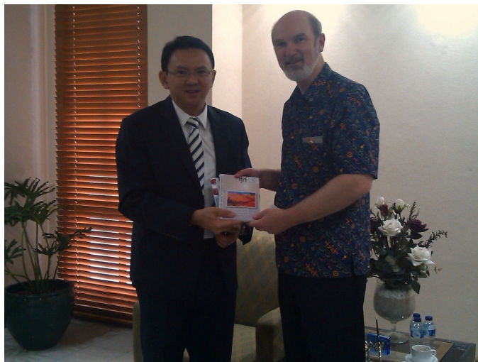
Tjahaja „Ahok“ Purnamas erhält die neueste Ausgabe der Zeitschrift für Religionsfreiheit

bekämpft hatte, wobei Ahok ihn automatisch 2014 als Gouverneur von Jakarta beerbte. Heute sitzt derselbe Christ für nichts im Gefängnis, und der Präsident wirkt wie gelähmt, seine Stimme dagegen zu erheben. Auch der Rat („Ulema“) der muslimischen Geistlichen des Landes, der schon oft deutliche Worte für die Religionsfreiheit gefunden hatte, schweigt plötzlich. Begreifen diese muslimischen Gelehrten nicht, dass sie selbst schnell die Nächsten sind, wenn es so weitergeht?