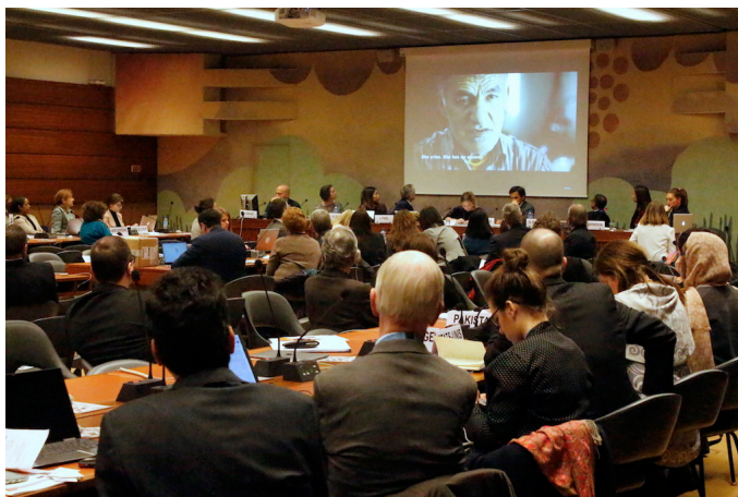
Während der Vorführung des Filmes „My Enemy, My Brother“