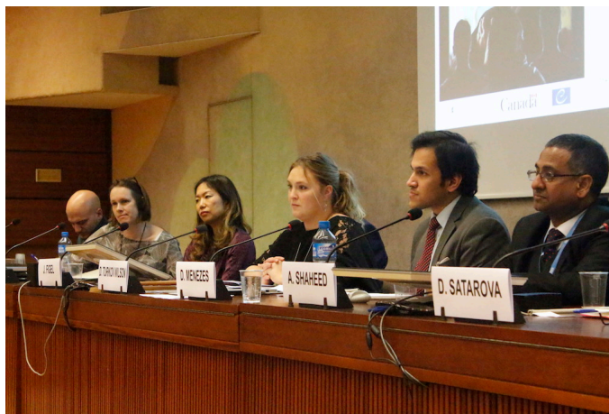
Die Redner während der Diskussionsrunde

Zusätzlich zu der Sammlung von Einführungsvideos wird eine zweite Gruppe kurzer Videos über „Zugang zur Rechtsmitteln“ geboten. In dieser Reihe gibt es bis jetzt nur vier Videos, und zwar nur auf Englisch. Weitere Schulungsvideos sind angekündigt.