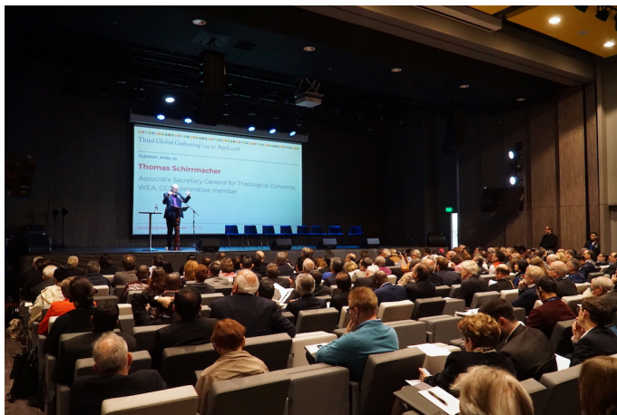
Thomas Schirmacher während seiner Rede (mit den Delegierten)

Unter den Teilnehmenden der globalen Versammlung waren auch Delegationen der katholischen Kirche (Päpstlicher Rat zur Förderung der Einheit der Christen), der Weltgemeinschaft der Pfingstkirchen, des Ökumenischen Rates der Kirchen (ÖRK), der Weltweiten Evangelischen Allianz und zahlreicher anderer weltweiter christlicher Gemeinschaften und internationaler christlicher Organisationen.