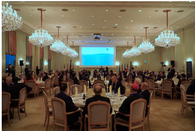
Blick in den Saal von hinten beim Bankett

Ägypten, Tunesien, Russland, den Vereinigten Staaten, dem Vereinigten Königreich, Georgien, Belarus, der Ukraine, der Türkei, dem Vatikan, dem Libanon, Usbekistan, Kroatien und Montenegro teil.