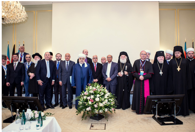
Einige der Teilnehmer im Gruppenbild mit Großscheich Sheikh-ul-Islam Allahshukur Pashazade (Mitte)