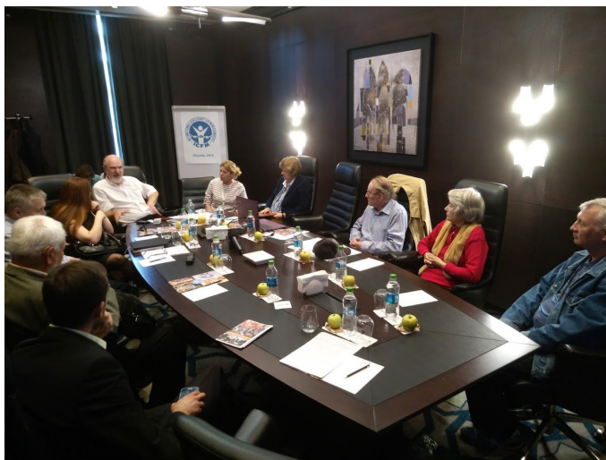
Im Gespräch mit Menschenrechtsverteidigern