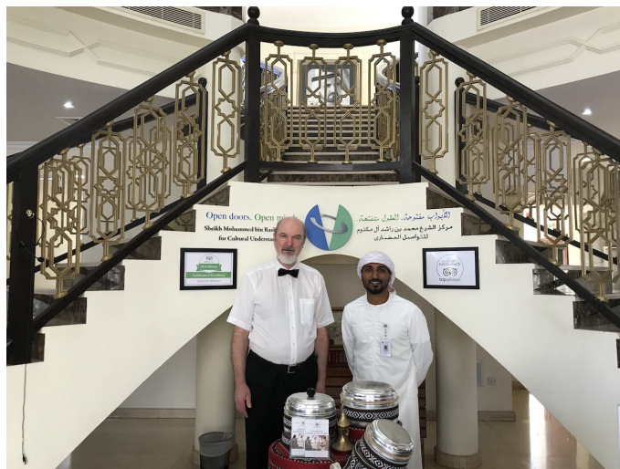
Dialog in der Jumeirah Moschee in Dubai

Daneben besuchten sie einen Gottesdienst am Strand von Dubai unter dem Burj al Arab. Der Gottesdienst war ein Ergebnis des Papstbesuches in Abu Dhabi, an dem auch Schirmmacher teilnahm. Thomas Schirmmacher nahm auch an den beiden großen Dialogkonferenzen teil, wobei die zweite im Zusammenhang mit dem Papstbesuch stattfand. Schirmmacher zeigte sich erfreut, dass die Gespräche mit der Regierung von Abu Dhabi im Kontext der Dialogkonferenzen auch Früchte für die Freiheiten von ausländischen Protestanten zeigten.