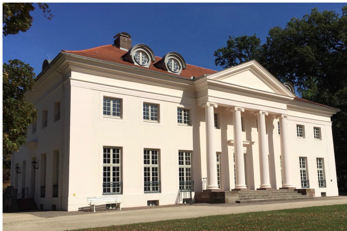
Das Schlösschen Schönburg, Veranstaltungsort der Tagung

Schirmmacher verwies darauf, dass das Märtyrertum im 20. Jahrhundert im Nahen Osten erst von säkular-nationalistischen Bewegungen eingesetzt wurde. Erst aufgrund von deren Erfolgen mit Selbstmordattentaten seien diese von islamistischen Gruppierungen übernommen und im Nachhinein theologisch aufgewertet worden.