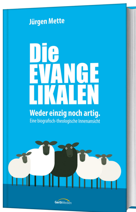
Cover © Gerth Medien

SOS World (Brüssel) www.sosworld.be/page-daccueil/