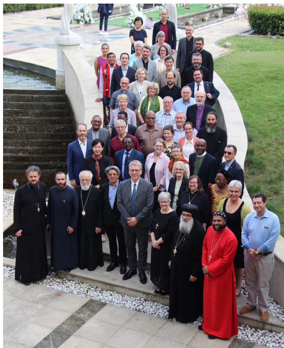
Die Kommission für Glauben und Kirchenverfassung der ÖRK-Tagung in Nanjing