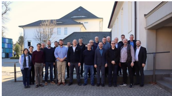
Dozenten und Mitarbeiter des Martin Bucer Seminars im Frühjahr 2019

In den heutigen akademisch-theologischen Ausbildungsstätten ist diese Grundhaltung leider eine Rarität. Für mich – ich hatte zuvor meinen Bachelor an einer Universität mit historisch-kritischer Auslegung absolviert – war dies eine Wohltat. Besonders schätzen gelernt habe ich auch die intensiven, aber immer freundlich geführten Diskussionen während der Seminartage.