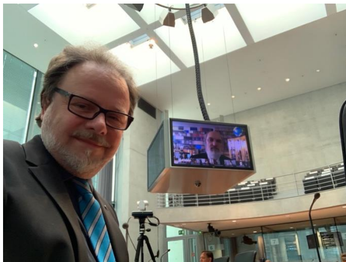
Der Bundestagsabgeordnete Frank Heinrich folgt den Ausführungen von Thomas Schirmmacher auf einem Übertragungsschirm im Deutschen Bundestag

In ihrem Bericht für den Zeitraum 2018 und 2019 (19/23820) hatte die Bundesregierung einen weltweiten Trend zur Einschränkung des Menschenrechts auf Religions- und Weltanschauungsfreiheit verzeichnet. Neben der digitalen Kommunikation seien insbesondere Blasphemie- und Anti-Konversionsgesetze eine aktuelle Herausforderung bei der Gewährleistung dieses Menschenrechts: Diese würden sich „unter dem Vorwand des Schutzes der Religions- und Weltanschauungsfreiheit oft als Einfallstor für die