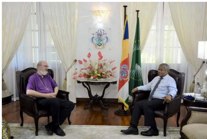
Audienz von Thomas Schirmmacher bei Wavel Ramkalawan, Präsident der Seychellen, im State House in Victoria

(Bonn, 11.01.2022) Auf einer kürzlichen Reise auf die Seychellen traf der Generalsekretär der Weltweiten Evangelischen Allianz (WEA), Bischof Dr. Thomas Schirmmacher, mit dem Präsidenten des Inselstaates zusammen und sprach über die positive Bilanz des Landes bei der Korruptionsbekämpfung, die Gewährleistung der Religions- und Glaubensfreiheit und die Bemühungen zum Schutz der Umwelt. Er traf auch mit der Führung der Evangelischen Allianz der Seychellen zusammen, um unter anderem die Situation rund um Covid-19, das Engagement der Kirchen für die Bewahrung der Schöpfung und die Führungsrolle der Allianz im Interreligiösen Rat zu erörtern.