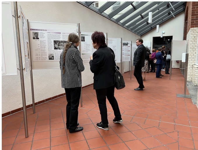
Die Ausstellung umfasst 30 Tafeln