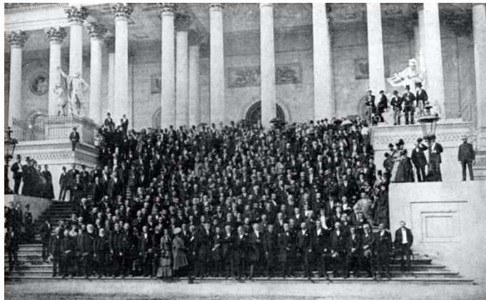
„Goodly Fellowship“ enthält viele historische Fotografien, darunter das obige Bild mit dem Titel „The New York (U.S.A.) Conference 1873: Gruppe auf den Stufen des Kapitols in Washington“.

Die WEA wurde ursprünglich gegründet, um Einheit zu fördern, und zwar mit einem Ziel und einer Mission. Sie hat die jährliche Gebetswoche für Einheit angeregt, die auch heute noch in vielen Ländern begangen wird; sie hat die Weitergabe des Evan-