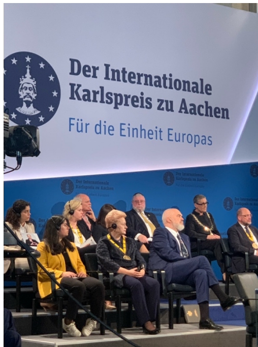
Weitere Preisträger des Karlspreises mit Edi Rama und Pinchas Goldschmidt

In der Begründung der Jury für die Preisverleihung heißt es: „In Würdigung seines herausragenden Wirkens für den Frieden, die Selbstbestimmung der Völker und die europäischen Werte, für Toleranz, Pluralismus und Verständigung, und in Anerkennung seines bedeutenden Engagements für den interreligiösen und interkulturellen Dialog ehrt das Direktorium der Gesellschaft für die Verleihung des Internationalen Karlspreises zu Aachen im Jahr 2024 den Präsidenten der Konferenz der europäischen Rabbiner, Oberrabbiner Pinchas Goldschmidt, und gemeinsam mit ihm die jüdischen Gemeinschaften in Europa. Das Karlspreisdirektorium will mit dieser Auszeichnung das Signal setzen, dass jüdisches Leben selbstverständlich zu Europa gehört und in Europa kein Platz für Antisemitismus sein darf. Jüdisches Leben ist ein wichtiger Teil der europäischen Geschichte und Gegenwart – jetzt und in Zukunft.“