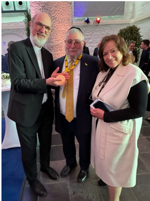
Thomas Paul Schirmmacher mit Pinchas und Dara Goldschmidt

Bischof Schirmmacher gehört auf Einladung von Goldschmidt dem Beirat des Instituts für Glaubensfreiheit und Sicherheit in Europa (IFFSE) in Brüssel an, das von der Konferenz der Europäischen Rabbiner verantwortet wird. Er hatte sich bereits vor dem Festakt mit dem Preisträger