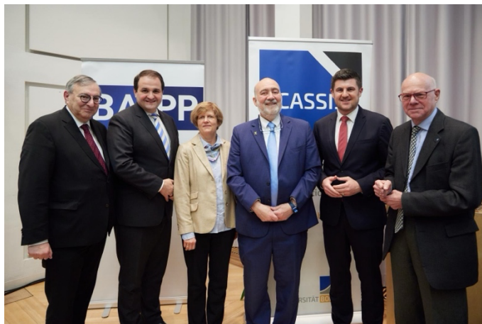
Die Teilnehmer der Podiumsdiskussion