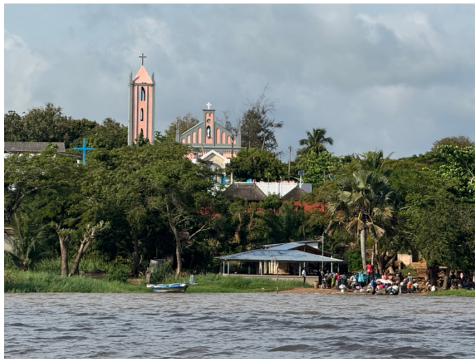
Togoville

den Katholizismus aufzuzwingen, obwohl Frankreich zu Hause eine strikte Trennung von Kirche und Staat praktizierte. Dies führte zu einem langen Kampf zwischen den Anhängern des Voodoo und der katholischen Kirche, den Johannes Paul II. zu beenden versuchte. Das Zentrum des Kampfes war Togoville, das auch heute noch ein wichtiges Zentrum für die Ausübung des Voodoo und die Ausbildung von Voodoo-Priestern ist, mit Voodoo-Schreinen und Voodoo-