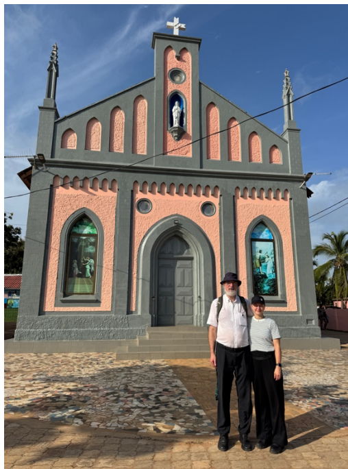
Die Kathedrale in Togoville

Die Kathedrale von Togoville „Notre-Dame du Lac Togo“ wurde 1910 von den Deutschen als lutherische Kirche erbaut. Als die Franzosen die Macht übernahmen, wandelten sie sie in eine katholische Kathedrale, wie sie es auch mit der lutherischen Kathedrale in Lomé taten. Anfang der 1970er Jahre soll am 7. November die Jungfrau Maria am Togosee erschienen sein, und seitdem sind das Kanu und der Schrein als „Maria am See“ ein Zentrum für Pilger. 1985 besuchte Papst Johannes Paul II. die Kathedrale, wo noch immer das Dock für sein Boot zu sehen ist, das extra für seinen Besuch gebaut werden musste. Während seines Besuchs erklärte der Papst, dass er glaube, dass der Glaube an Maria und an Voodoo nebeneinander bestehen und gemeinsam praktiziert werden können, da Voodoo auch nach dem Ewigen strebe. Er sagte: „Die christliche Nächstenliebe verlangt die Akzeptanz traditioneller Praktiken, die vernünftig, gerecht, wahr, nützlich und mit dem Glauben an den einen Gott vereinbar sind.“ Die Kirche, fuhr er fort, wolle vermeiden, „das gute Korn vorschnell mit dem schlechten wegzwerfen“.