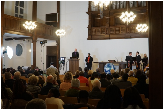
Erzbischof Thomas Schirmacher, Metropolitan der Erzdiözese der India Christian Mission für Kontinentaleuropa, spricht zum Thema „Der Weltfrieden beginnt in kleinen Kreisen“

SOS World (Brüssel) sosworld.be/page-daccueil/