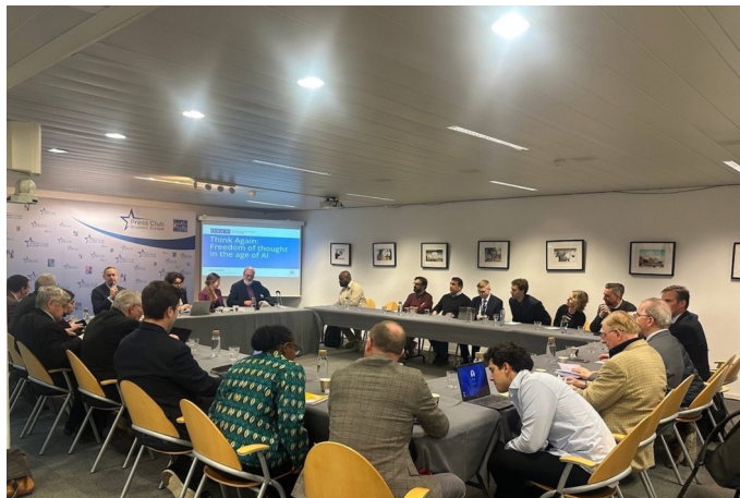
Der FoRB Roundtable EU Brussels bei seinem letzten Treffen zusammen mit der OSZE/ODIR