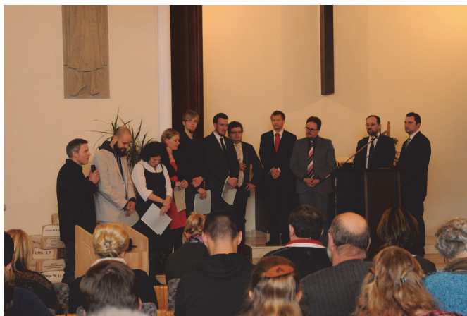
Segnung der Absolventen

Zwei der Absolventen gaben einen persönlichen Rückblick auf ihre Studienzeit. Beide waren sich einig, dass sie diesen Tag mit einem lachenden und einem weinenden Auge begehen: Auf der einen Seite die Freude über den erfolgreichen Abschluss des Studiums. Auf der anderen Seite der Abschied vom Seminar, den Dozenten und den Kommilitonen. Sie