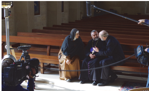
Filmaufnahmen in Beirut

mit einem ZDF-Filmteam, das syrische Flüchtlinge, Kirchenführer und den Großmufti des Libanon interviewte. Im Libanon halten sich die meisten kirchlichen Oberhäupter der syrischen Kirche sicherheits- halber auf. Der Großmufti des Libanon Mohammed Rashid Qabbani ist der bedeutendste muslimische Theologe des Landes und an einem friedlichen Zusammenleben von Christen und Muslimen interessiert.