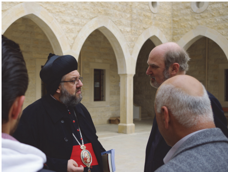
Im Gespräch mit Flüchtlingen und Metropolit Clemis Danile Kourieh

muslimischen Nachbarn zu sprechen oder die Religionszugehörigkeit der Terroristen auszusprechen. Vielmehr hofft man immer noch, dass es wieder zu einem friedlichen Zusammenleben kommen wird.