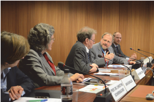
Heiner Bielefeldt, UN-Sonderberichterstatter für Religions- und Glaubensfreiheit im Austausch mit Christine Schirmmacher (ganz links)

Obwohl es in den wenigsten Ländern weltweit staatliche Gesetze gibt, die den Abfall vom Islam (bzw. einer anderen Religion) verbieten und unter Strafe stellen, so Schirmmacher, haben besonders Konvertiten, aber auch Angehörige nicht anerkannter Minderheiten unter Diskriminierung, Einschränkungen ihrer Rechte, Drangsalierung und teilweise Verfolgung und Misshandlung zu leiden. Manche erleiden aufgrund ihres Glaubenswechsels bzw. ihrer Zugehörigkeit zu einer anderen als der vor Ort propagierten Variante des Islam sogar den Tod. Hintergrund in islamisch geprägten Ländern ist die Berufung auf das Schariarecht, das bis zum 10. Jahrhundert n. Chr. durch die Auslegung von Koran und Überlieferung durch namhafte islamische