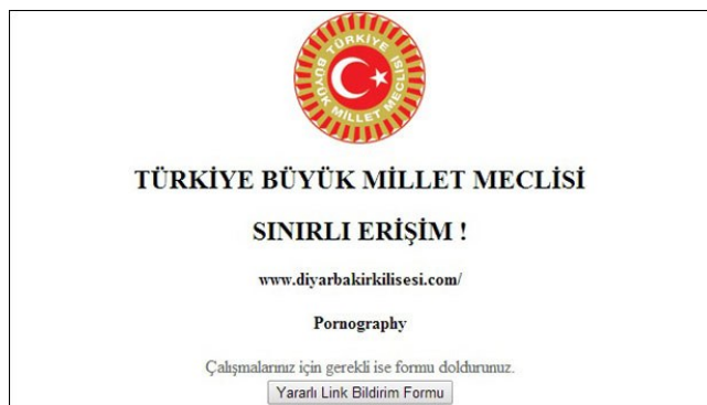
Screenshot von einem Computer des Türkischen Parlaments