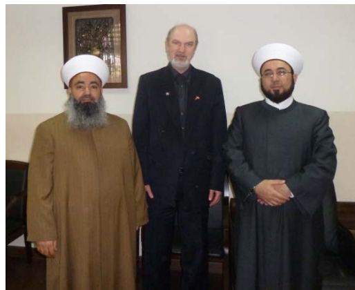
Mit den Obersten Schariarichtern von Saida