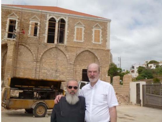
Vor der Baustelle des neuen Genozidmuseums in Byblos mit Bischof Nareg Alemezian