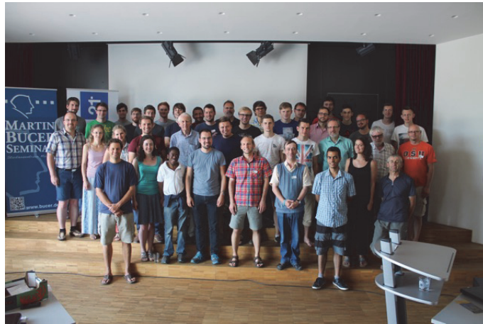
Ein Teil der knapp 60 Teilnehmer der diesjährigen Konferenz

Neben erbaulichen Vorträgen kommt die Gemeinschaft unter den Teilnehmern nicht zu kurz. Während den Mahlzeiten, in Pausen und Freizeiten lernt man sich besser kennen und tauscht über eigene Erfahrungen im Verkündigungsdienst aus.