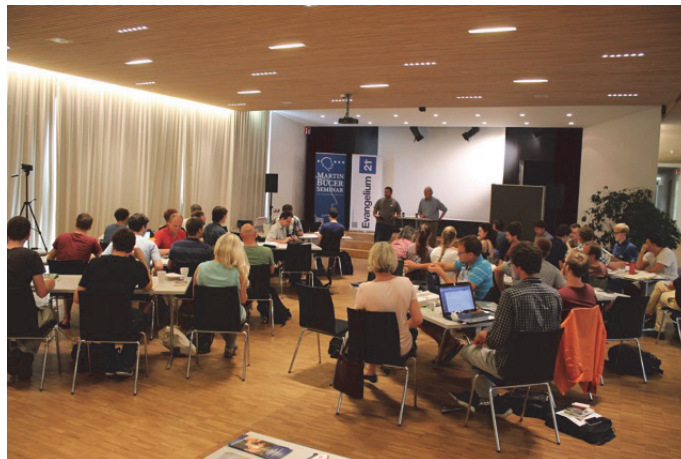
Blick ins Plenum der diesjährigen Konferenz

Die Konferenz fand vom 5. Bis 8. August in München statt und wurde von knapp 60 Teilnehmern besucht. Benannt nach Charles Haddon Spurgeon, dem „Fürsten der Prediger“, startete die Veranstaltung im Sommer 2014 zum ersten Mal. Sie wird gemeinsam vom Martin Bucer Seminar München und dem Netzwerk Evangelium21 veranstaltet. Anliegen der Konferenz ist es, vollzeitliche und ehrenamtliche Verkündiger zur textauslegenden Predigt zu ermutigen und dafür praktische Hilfestellungen zu geben. Während der Konferenz erhalten die Teilnehmer einen gründlichen Einblick in jeweils ein biblisches Buch und lernen, wie sie dessen Inhalt lebensnah in Predigt und Lehre weitergeben können.